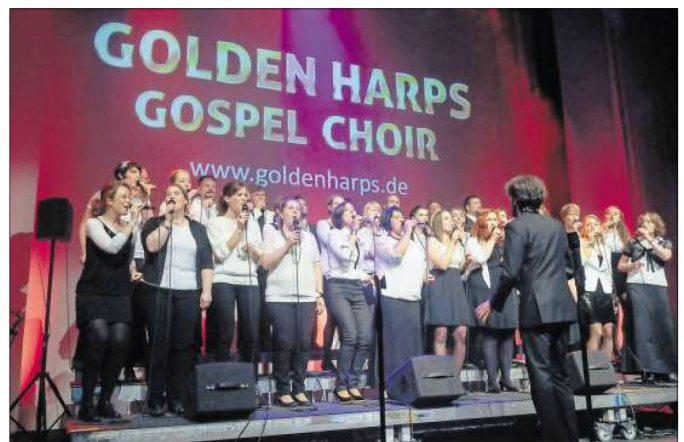
...wie bei Auftritten in großen Hallen.