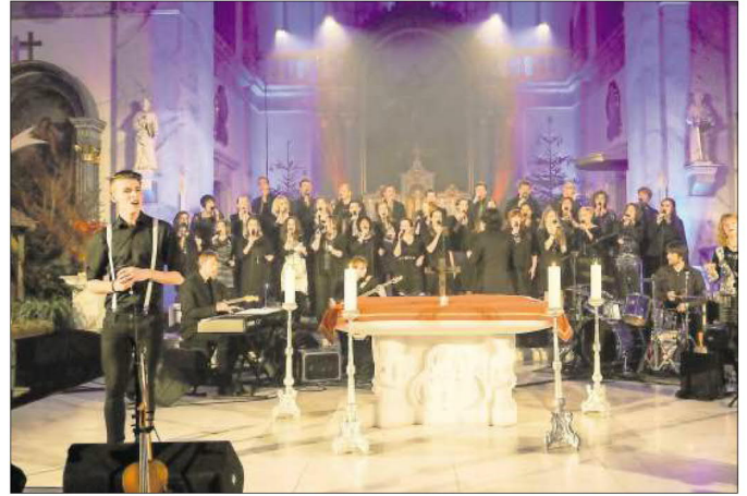
Konzerte in den Kirchen der Region sind ebenso stimmungsvoll...

Gospelmusik bedeutet heutzutage eine stetige Weiterentwicklung des Genres rund um den Globus. Die Musik, die stilistisch nur noch wenig mit den Liedern der Sklaven auf den Plantagen der amerikanischen Südstaaten zu tun hat, besitzt eine Schnittmenge zu Soul, R'n'B und Pop. Entscheidend dabei ist, dass die Aussagen der Lieder bei aller Weiterentwicklung seit jeher die gleichen geblieben sind.